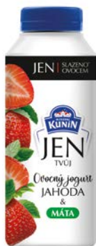
Jahoda & máta