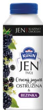
Ostružina & bezinka