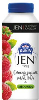
Malina & meduňka